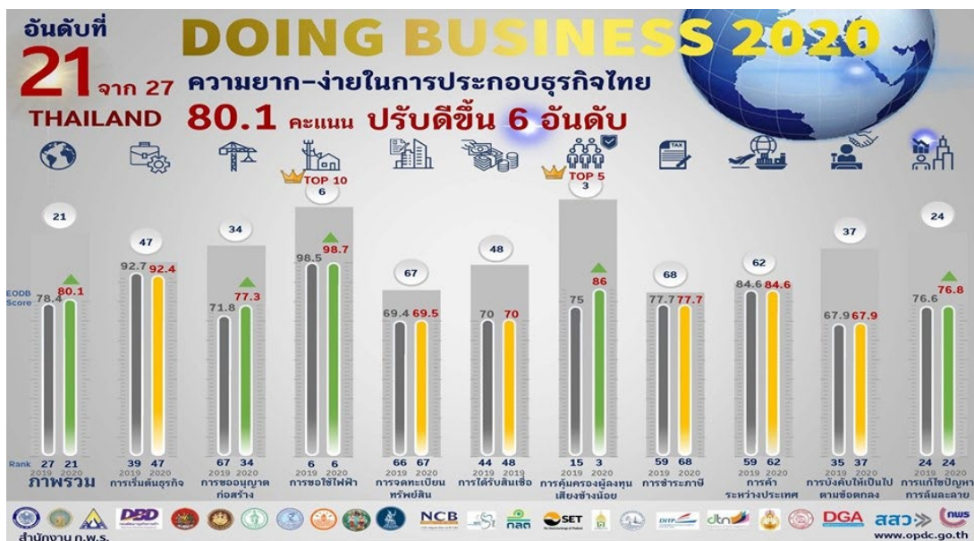
ภาพที่ 5 การจัดอันดับความยาก-ง่ายในการประกอบธุรกิจ (Doing Business : DB) ในปี 2020