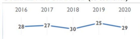
ภาพที่ 2 อันดับความสามารถในการแข่งขันของประเทศไทย รายงานโดย World Competitiveness Center